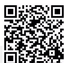
V110 3D Demo